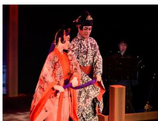
『Tamatsu's Love—from Kumiodori 'Temizu-no-En'』 ACO Okinawa (Japan)