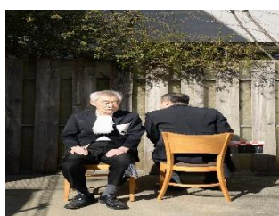
『Echoes from the Nourshing Cinema』 Theater company Tokyo Kandenchi (Japan)