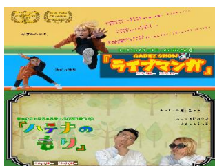
『LIVE MANGA』 『HATENA NO MORI』 Pantomime Comedy Duo GABEZ (Japan)