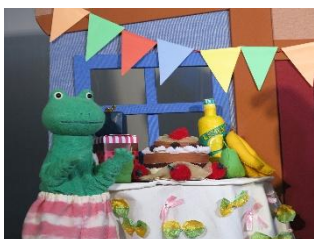
『KAERUKUN AND FRIENDS』 PUPPET THEATER HIPOPOTAAMU (Japan)