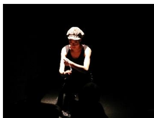
『Les Mis é lables』 ACO Okinawa (Japan)