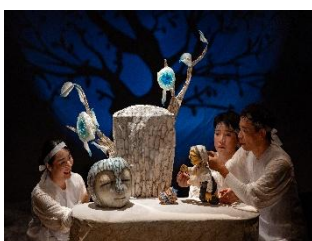
『Puppet of Blue』 ACO Okinawa/ArtstageSAN (Japan/South Korea)