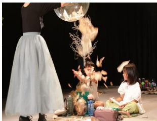
『A Story of the Moon's Journey』 Hospital Theatre Project 2025 (Japan)