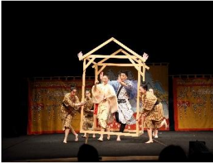
『OKINAWA SANSAN』 ACO Okinawa (Japan)